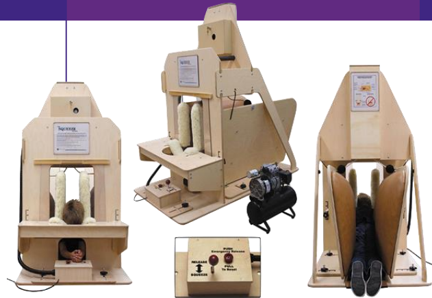
Machine à serrer