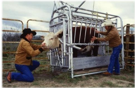
Travail à ferrer