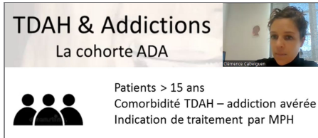
Projet de cohorte avec des personnes ayant un TDAH et trouble addictif sur le Grand Ouest (Nantes-Tours-Brest)