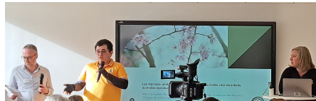
Session portant sur des projets relatifs aux aspects sensoriels , animée par des personnes concernées par un TSA