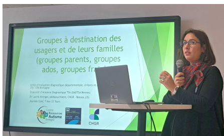
Panorama des outils donnés aux personnes concernées et aux aidants sur le territoire du Grand Ouest