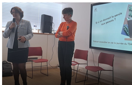
La parole donnée aux associations : ADAPEI44 et HyperSupers-TDAH .