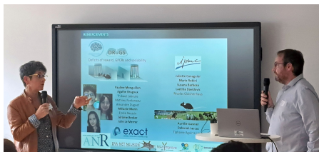
Echanges entre neuroscientifique et néonatalogiste sur le sujet de la nutrition maternelle, projet soutenu par le CRNH-Ouest