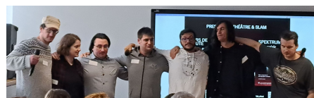
Les acteurs de l' atelier de création artistique de l'association Alva et du groupe Spektrum . Un grand bravo pour leur prestation tout en poésie !