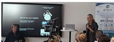
Présentation d'un habitat inclusif par l'Association Alva